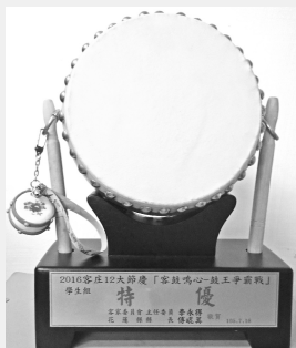
2016客庄12大節慶 「客鼓鳴心-鼓王爭霸戰」 學生組特優